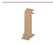
Verbinder (nur für S 60) mit Kompensator